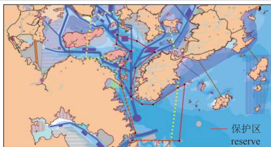
图2 福建省宁德市官井洋大黄鱼国家级水产种质资源保护区(来自宁德市海洋与渔业局)